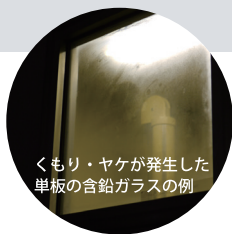
くもり・ヤケが発生した 単板の含鉛ガラスの例

電 放射線防護工事・線量測定・遮へい計算・関連用品販売 医建エンジニアリング株式会社